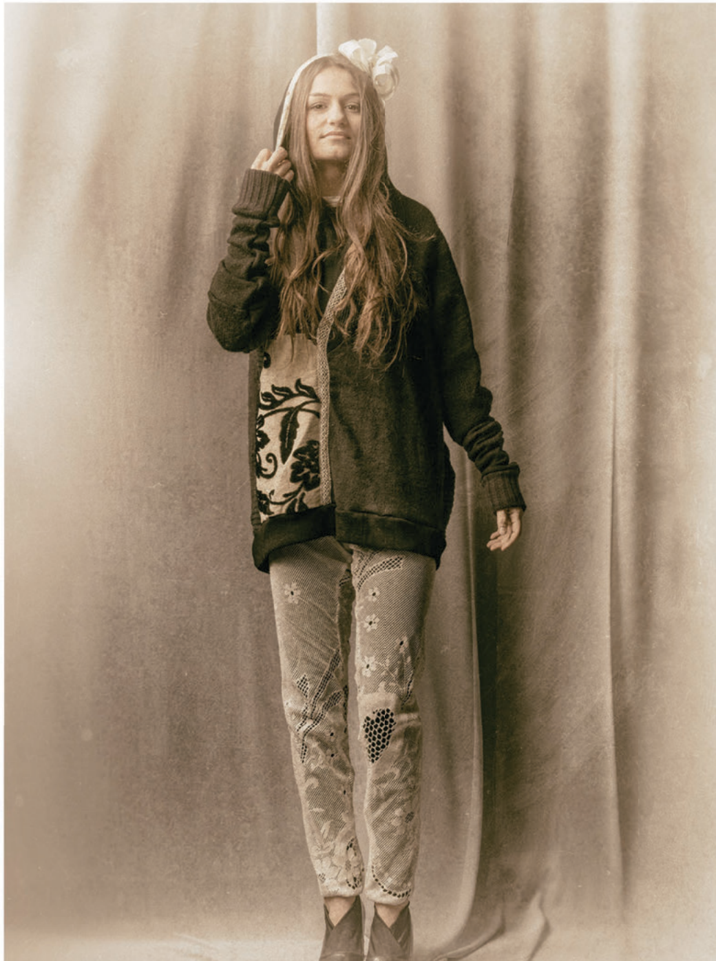
VARIATIO JERSEI VIENA